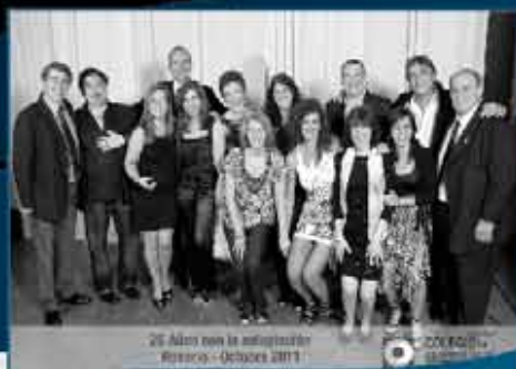
25 años con la adhesión Rosario - Octubre 2011