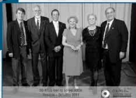
30 años con la adhesión Rosario - Octubre 2011

Avanzada la noche con la invitación del Colegio a todos los estudiantes de la Facultad de odontología de Rosario U.N.R.