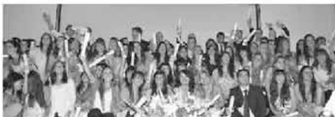
PROMOCION 2010 /2011

Los Actos Académicos culminaron con la Colación de Grado de la Promoción 2010 / 2011, y el cambio de abanderados de la Institución para el Ciclo 2012.