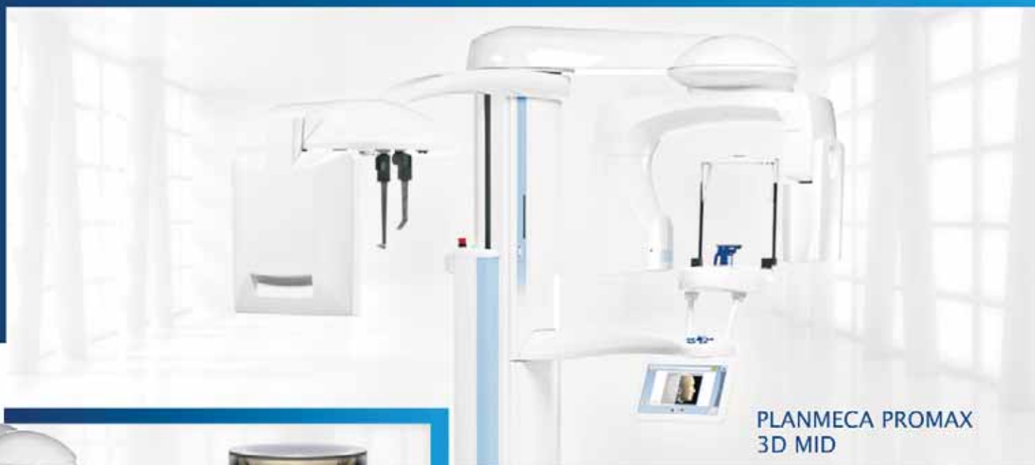
PLANMECA PROMAX 3D MID